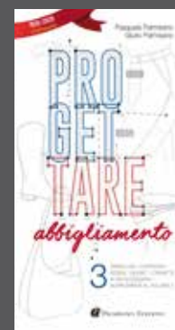
Le nostre pubblicazioni